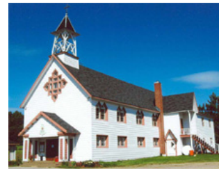
Avenir de l'église de Lac-du-Cerf

Le Conseil municipal a adjugé le contrat au plus bas soumissionnaire, lors de l'ouverture des soumissions, soit Les Pétroles Sonic.